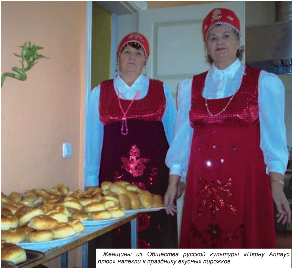
Женщины из Общества русской культуры «Пярну Апплаус плюс» напекли к празднику вкусных пирожков