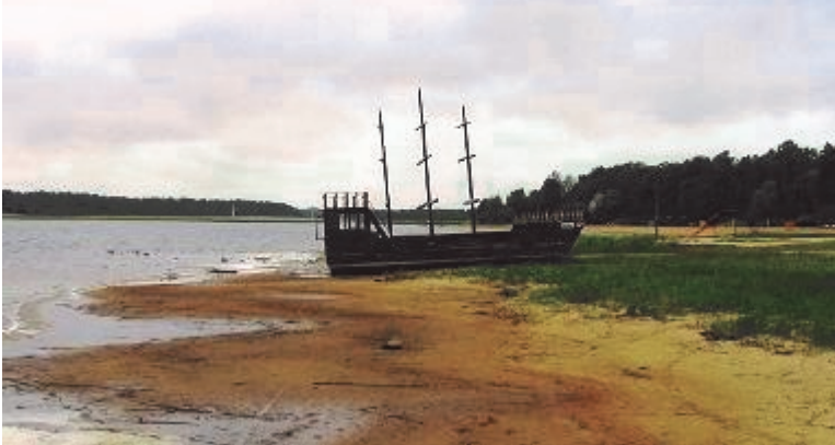
На берегу озера Тамула

Предложения в план развития можно приносить в письменной форме в Городскую управу или по электронной почте aivar.nigol@vorulinn.ee .