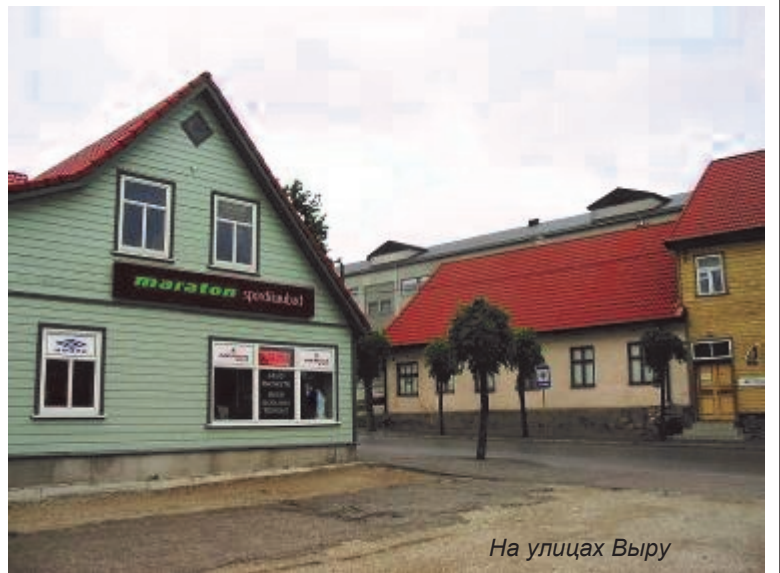
На улицах Выру