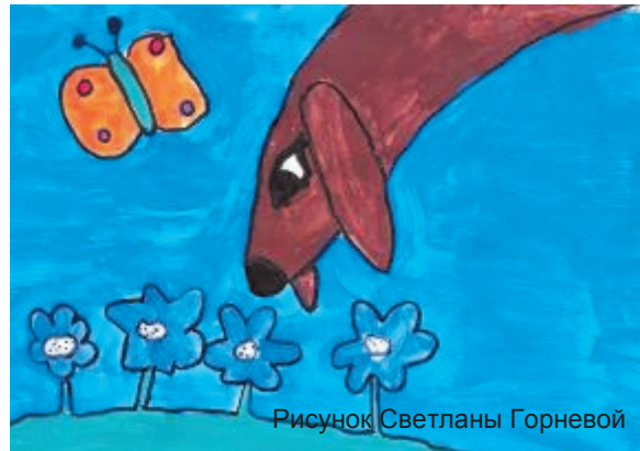
Рисунок Светланы Горневой