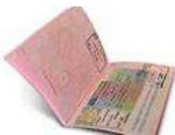
В Латвии время менять паспорта