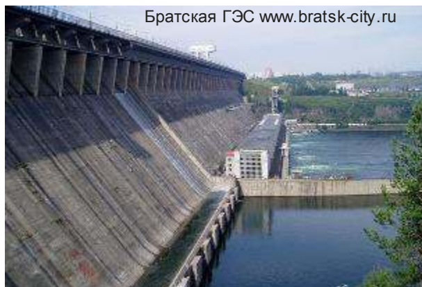
Братская ГЭС www.bratsk-city.ru