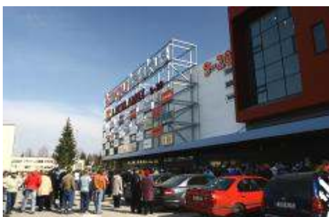
Новый торговый центр в Выру