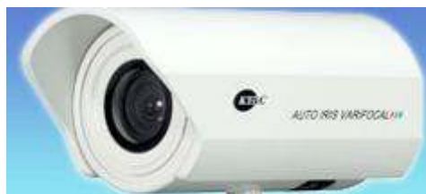
Камеры видеонаблюдения в городе