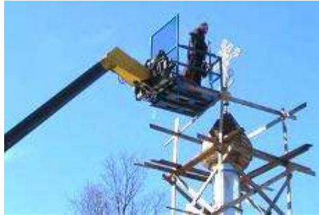
Новые кресты на православном храме Стр. 9