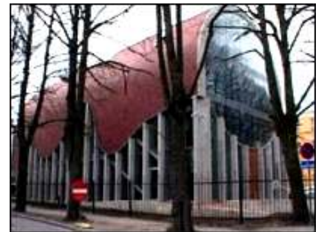
Еврейство в Эстонии