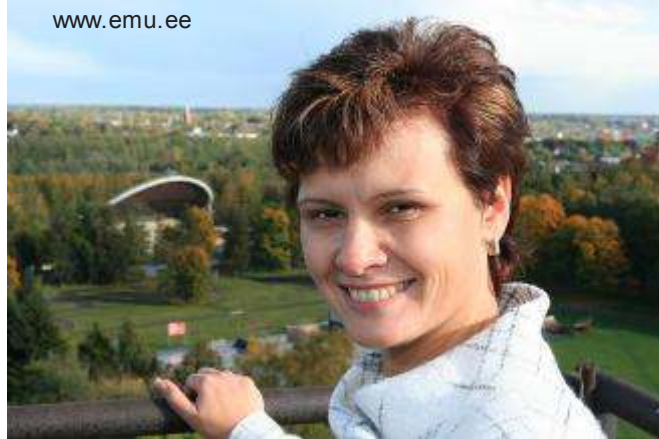
Министр культуры Лайне Янес на фоне Тартуского певческого поля

Коллективы с острова Сааремаа получают 899 558 и Хийумаа - 240 226 крон.