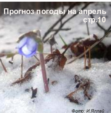
Прогноз погоды на апрель стр.10