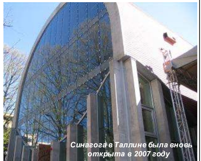
Синагога в Таллине была вновь открыта в 2007 году

Эстонское общество еврейской культуры было основано в Таллине 30 марта 1988 года. BNS