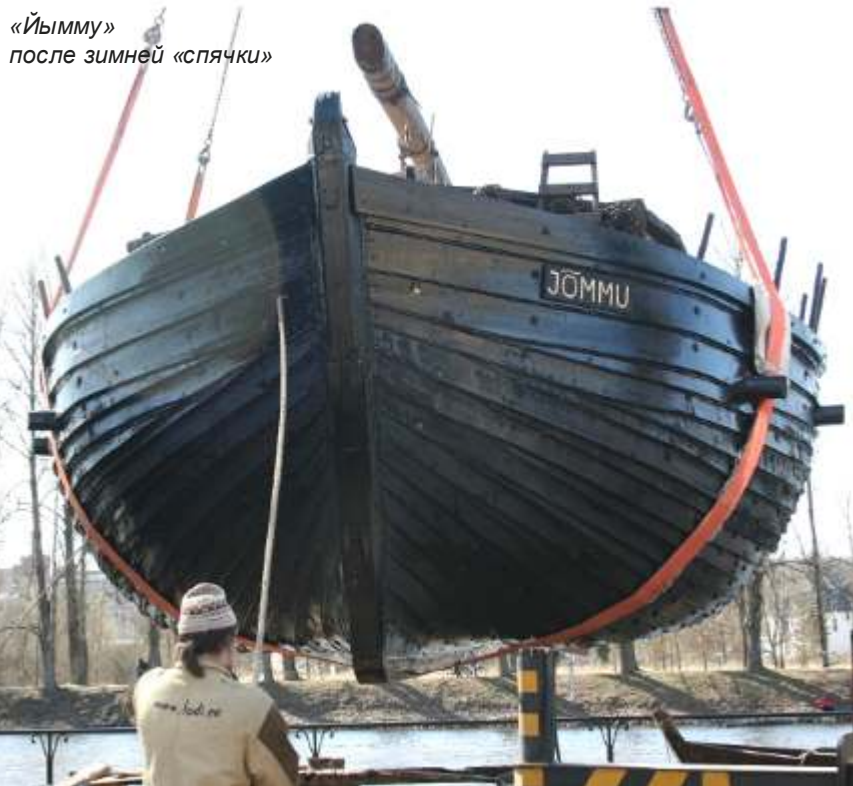
«Йымму» после зимней «спячки»

Постоянный адрес: gubernia.pskovregion.org/ number_382/11.php