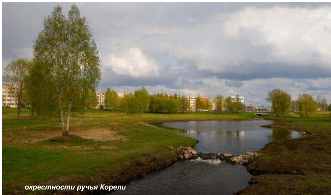
окрестности ручья Корели

Уютный город и довольные граждане вот мои приоритеты!