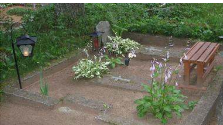
На фото: могила Святого до реконструкции. Справа: Церковно-краеведческий поход, на могиле о.Иоанна

Прихожане церкви Владимирской иконы Божией Матери г.Валга