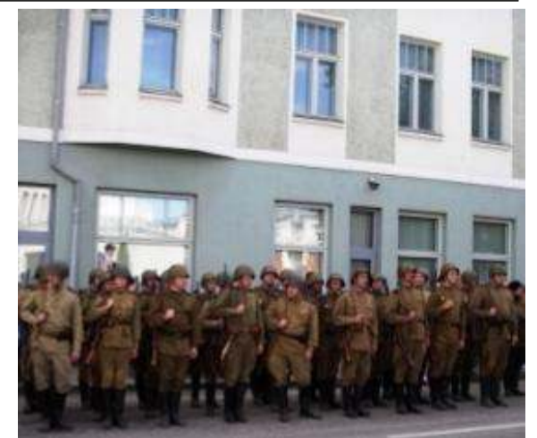
Фронт-лайнцы на военно-исторических днях в Валге.

Восемь из десяти задержанных и среди них четверо членов военно-исторического клуба оставлены под стражей на ближайшие шесть месяцев. Всех их подозревают в незаконном обороте оружия, боеприпасов, взрывчатых веществ и взрывных устройств.