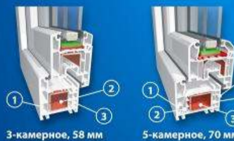
3-камерное, 58 мм

КУПИВ 2 ОКНА ИЛИ БОЛЬШЕ, ПОЛУЧИТЕ ПОДОКОННИК ПВХ НА 20% ДЕШЕВЛЕ!