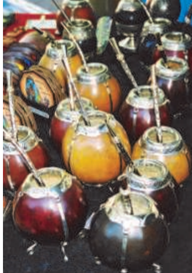
Сосуды из засушенной тыквочки - мате-калабаса.