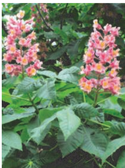
Соцветия уругвайских каштанов - розовые!

Статью Любовь Каринг-Мьюэнч о весне в Уругвае читайте на стр. 7