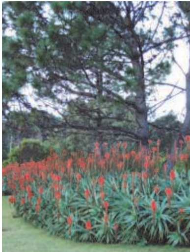
Зима в Уругвае - сезон цветения алоэ феррокс.

Приходит зима в Уругвай в июне. Это середина уругвайского учебного года. Потому в период европейского лета не следует ждать из Латинской Америки в Прибалтику туристов не пенсионного возраста. Зима в июле-августе с частыми, дующими сутками напролет, ледяными ветрами с Атлантики. Злой южный памперо (Pampero) понижает температуру воздуха очень быстро, оставляя уругвайцам всего пару градусов тепла. В дни зимней стирки, обрушивающиеся на берег волны буквально взмывают в океанской лохани воду меж черно-лавовых берегов. Воздушный миксер взбивает океан в густую, натающую пену. Она, словно надувные матрацы, то подплывает, то отчаливает от берегов. Растрепанная пена, метет поземкой, перекачиваясь пушистыми клочьями по нескончаемым обезлюдившим песчаным берегам. Цепляется за корявую, острую лаву берегов, переливается из перекипевшего океана на набереж-