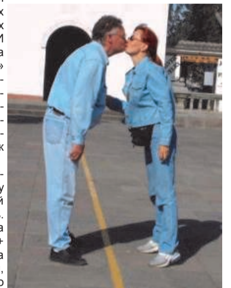
Поцелуй из разных полушарий мира через линию экватора (жёлтая). Эквадор

Уругвайский январь благоухает. Ярким облаком на оградах и стенах домов повисает колючая бугенвилля. Выстреливая вверх многометровыми цветоносами, раскрываются над дюнами ажурными зонтиками агавы. Клумбы и берега в эту пору сотканы в ковер из ярко-розового портулака. Вода к январю прогревается, и курорты страны в дельте Ла-Платы и по берегам Атлантического океана заполняются тысячами отдыхающих из Аргентины, Парагвая и Бразилии. А пешеходы в пыльном и шумном столичном Монтевидео, изнывая от духоты и жары, спасаются в тени вековых крон платанов и сиреневых куполов джакаранд. Или с берегов реки переезжают на океанское побережье на свои летние дачи – «чакры».