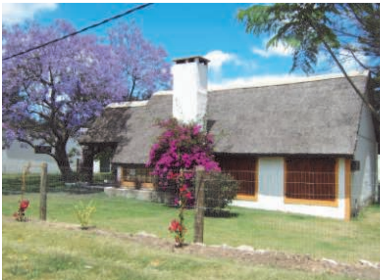
Январским знойным летом благоухает розовая бугенвилля и цветёт сиреневая джакаранда. Типичный дом на уругвайском побережье.