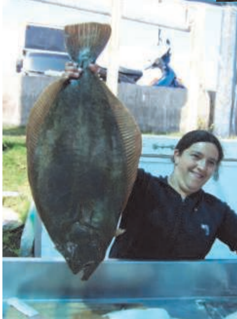
Вот такую камбалу вылавливают на Атлантическом побережье Уругвая