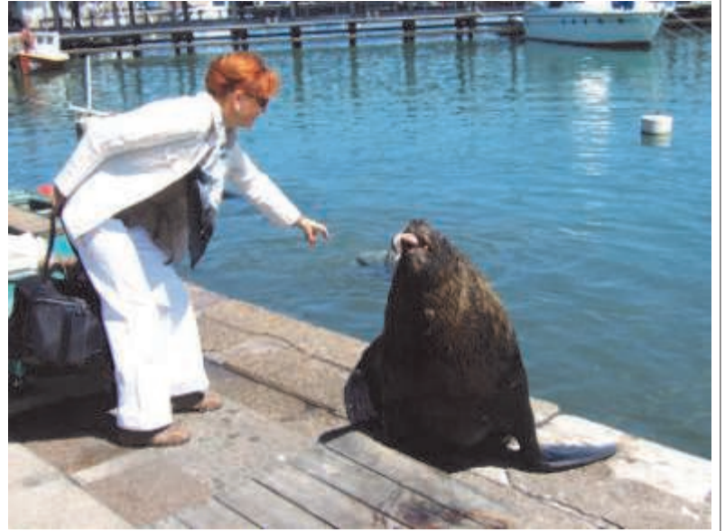
Морские львы охоти до свежей рыбки (курорт Пунта-дель-Эсте)

температура года. Около +25 С. Это середина весны. В декабре уругвайские и соседские: аргентинские, парагвайские, бразильские дети предвкушают: «Конец учебы! Летние каникулы!» 9-месячный учебный год в школах и университетах заканчивается в ноябре. Теплолюбивые уругвайцы радуются в сентябре: «Пришла весна!»