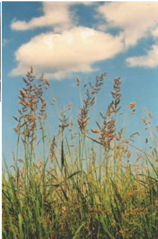
Справа: Летнее небо Ксения Копсо, 3 место