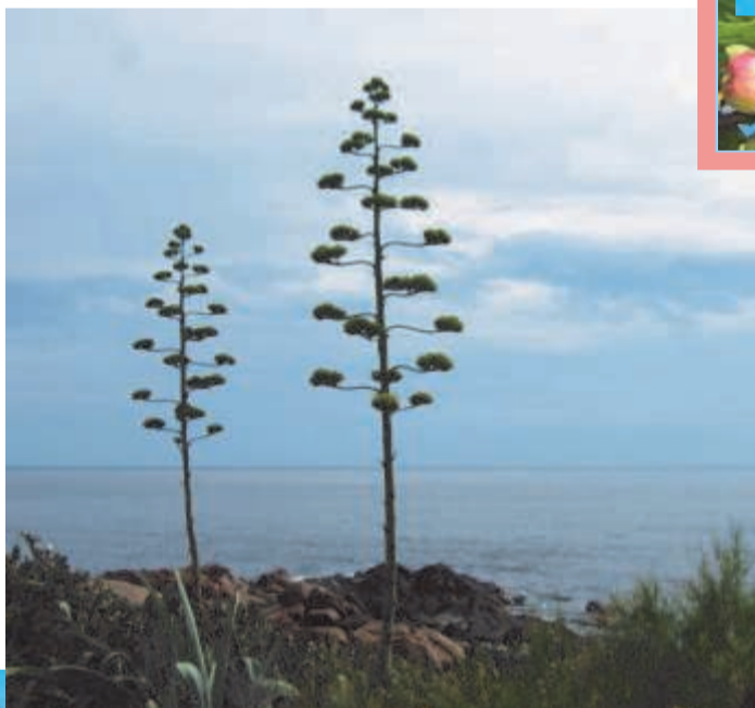
Зацветёт раз в век алоэ и, отдав все жизненные силы многометровому цветоносу, погибнет