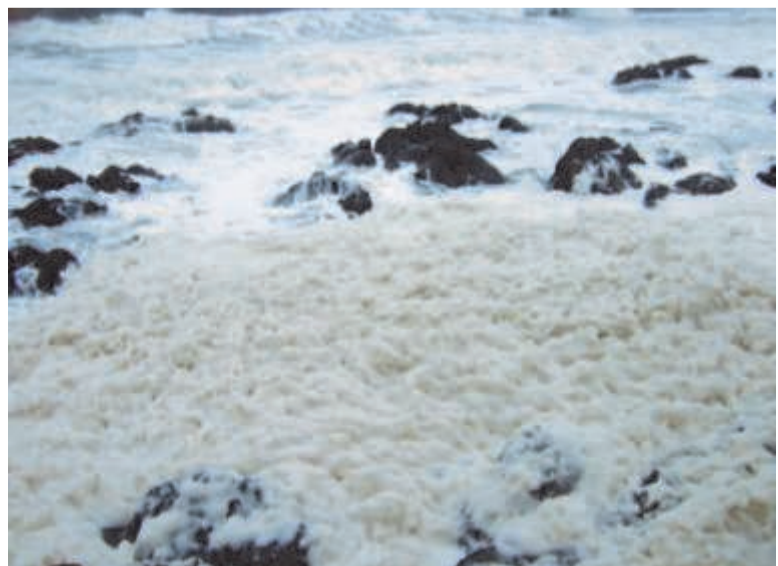
Там ветра взбивают океан