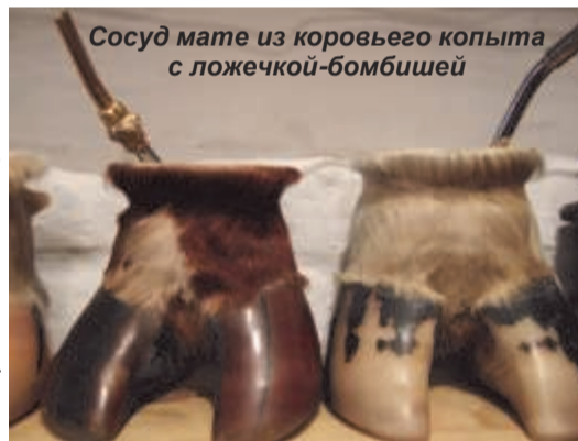
Сосуд мате из коровьего копыта с ложечкой-бомбишей

в сентябре и длится до начала декабря. В сентябре на берегах Рио-де-Ла-Плата и латиноамериканской Атлантики природа просыпается от зимнего сна. На платанах, акациях и джакарандах лопаются набухшие почки, покрываются розовыми свечками каштаны, покачиваются белыми колокольцами свечи юки (фото на странице 12). Из пазух банановых деревьев вылезают сиреневые бутоны, обрамленные пестиками будущих бананов, раскрываются розочки на