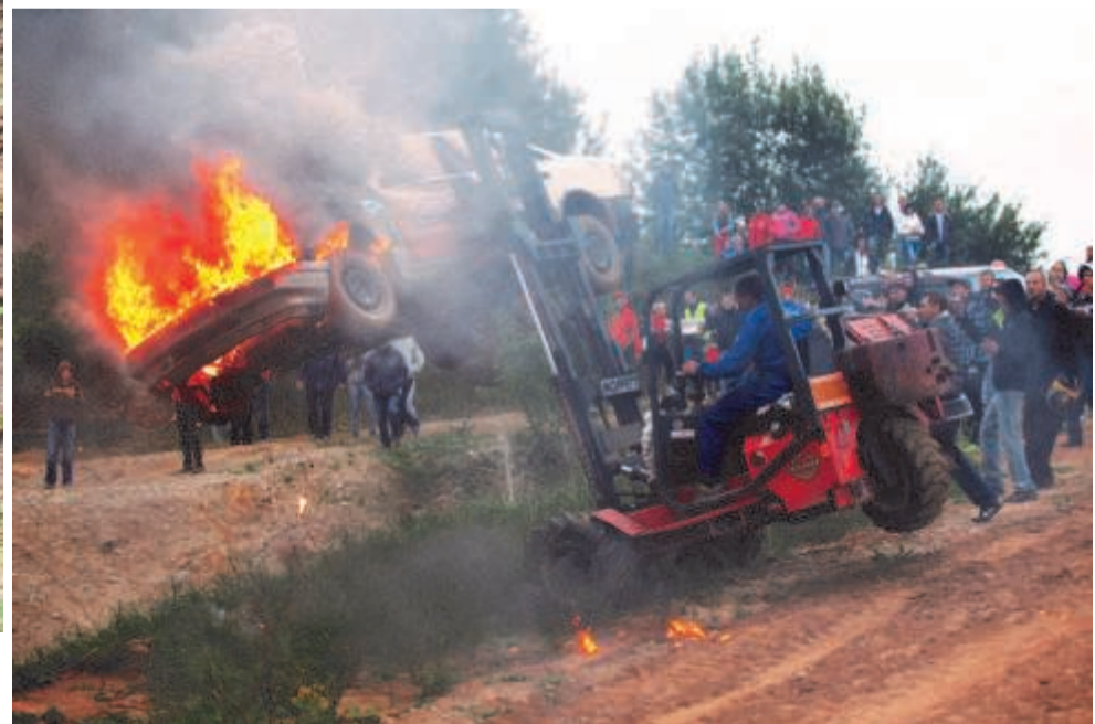
Ещё мгновение и кар окажется в канаве поверх пылающей машины. (Спасателю удалось спастись)

Алексей Берёзкин над «братским кладбищем»