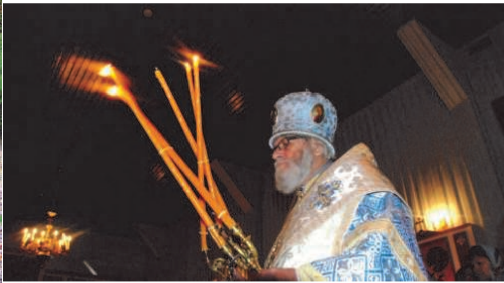
Сверху: митрополит Корнилий на богослужении. Снизу: русские песни исполняет ансамбль «Одуванчики».

О визите Его Высокопреосвященства, митрополита Таллинского и всея Эстонии Корнилия читайте на странице 9