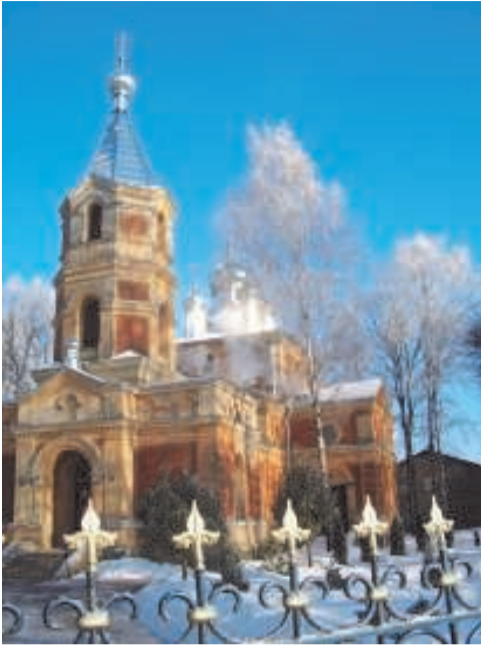
Храм Святого Исидора на центральном рынке в Валге. Православные верующие были изгнаны из него, после чего был заложен новый храм Владимирской иконы Божией Матери на улице Техника

Московский патриархат считает неправильным существование двух православных юрисдикций на территории Эстонии и призывает окончательно решить вопрос о церковном имуществе, сообщил председатель отдела внешних церковных связей Московского патриархата митрополит Иларион. Митрополит Иларион прибыл в Эстонию с официальным визитом, чтобы принять участие в торжествах по случаю столетия собора Пюхтицкого монастыря, а также для того, чтобы поздравить главу Эстонской Православной Церкви владыку митрополита Корнилия с 20-летием архиерейской хиротонии, и чтобы встретиться с верующими и с политическим руководством Эстонии, передать портал новостей государственного телерадиовещания (ERR). "В создавшейся ситуации мы считаем важным, чтобы продолжался диалог с властями Эстонии для того, чтобы было найдено окончательное решение имущественных проблем и чтобы продолжался диалог между православными верующими, которые сегодня, в