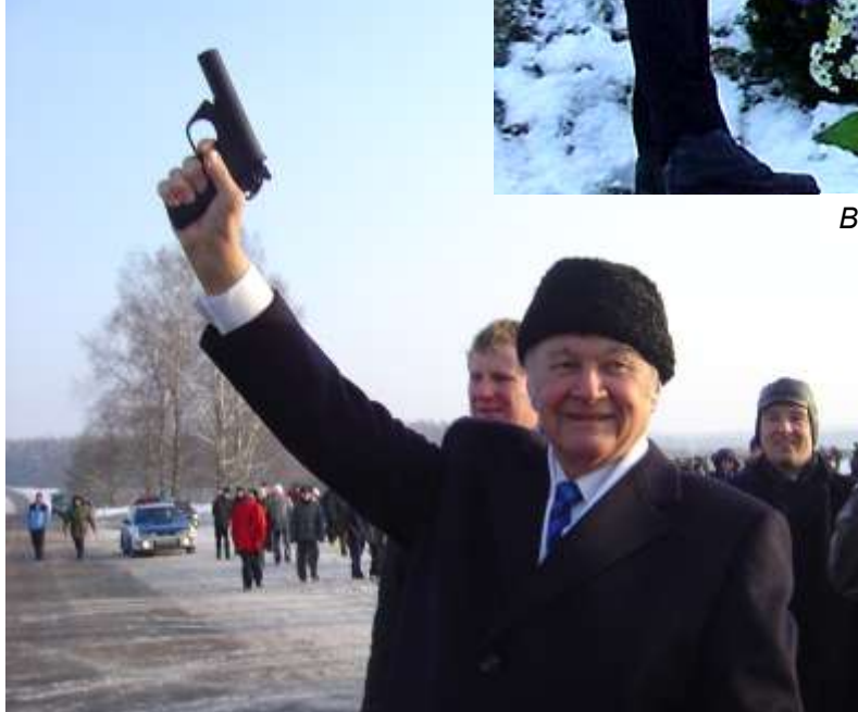
Президент Эстонской Республики господин Арнольд Рюйтель даёт старт забегу, посвящённому 85-й годовщине Паюской битвы

После провозглашения независимости Эстония была вынуждена участвовать в войне за свою независимость против Советской России и немецких войск. Во время