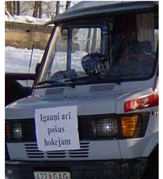
«Эстонцы тоже хотят играть в хоккей» - надпись на капоте машины