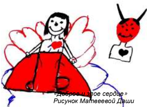
«Доброе и злое сердце» Рисунок Матвеевой Даши

«У людей сердца бывают разные: добрые, злые, счастливые и даже расстроенные сердца бывают. У меня сердце доброе, и я хочу, чтобы у всех людей были добрые сердца».