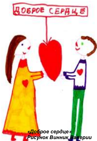
«Доброе сердце» Рисунок Винник Валерии