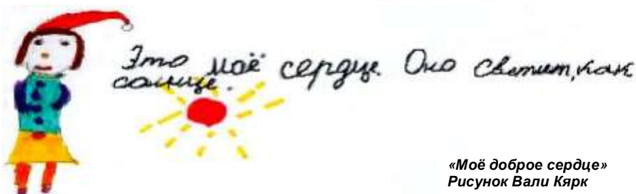
«Моё доброе сердце» Рисунок Вали Кярк