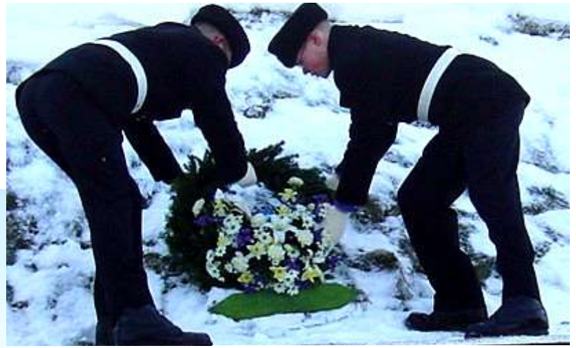
Возложение венка к монументу в Паю

этой войны Эстония укрепила свои границы и 2 февраля 1920 г. заключила Тартуский мирный договор с Советской Россией.