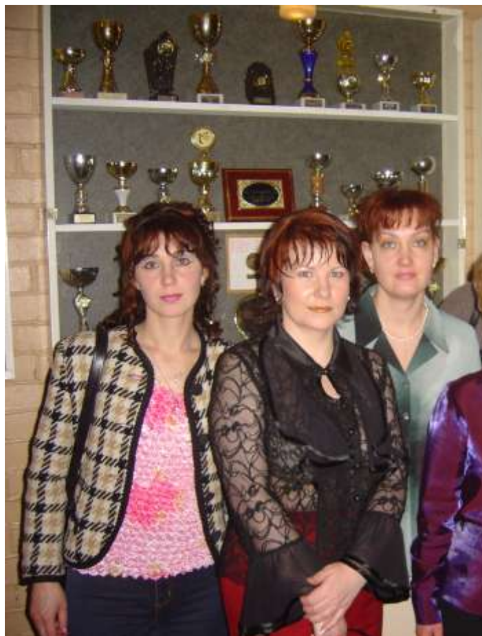
Им сегодня 20!

очень скромно. Современные дети, наверное, такого строгого порядка не поймут. Сейчас всё можно. В те времена было лучше, люди были добрее».