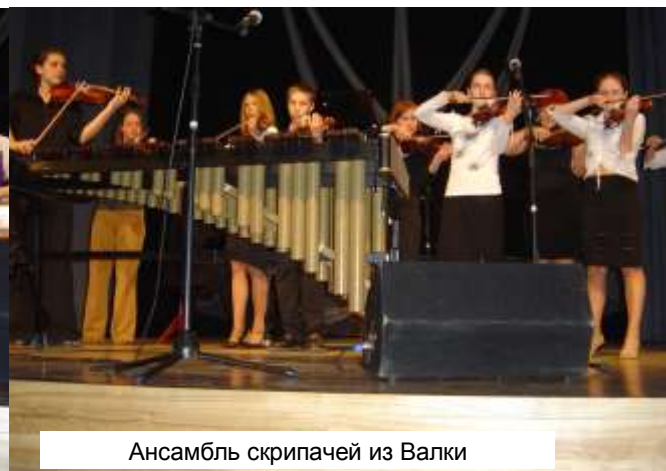
Ансамбль скрипачей из Валки