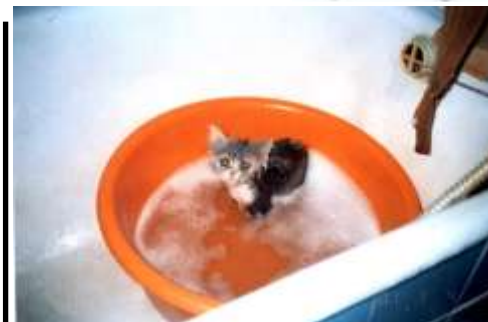
Какие испуганные глазки! Это фотография Даши Григорьевой. 6 класс