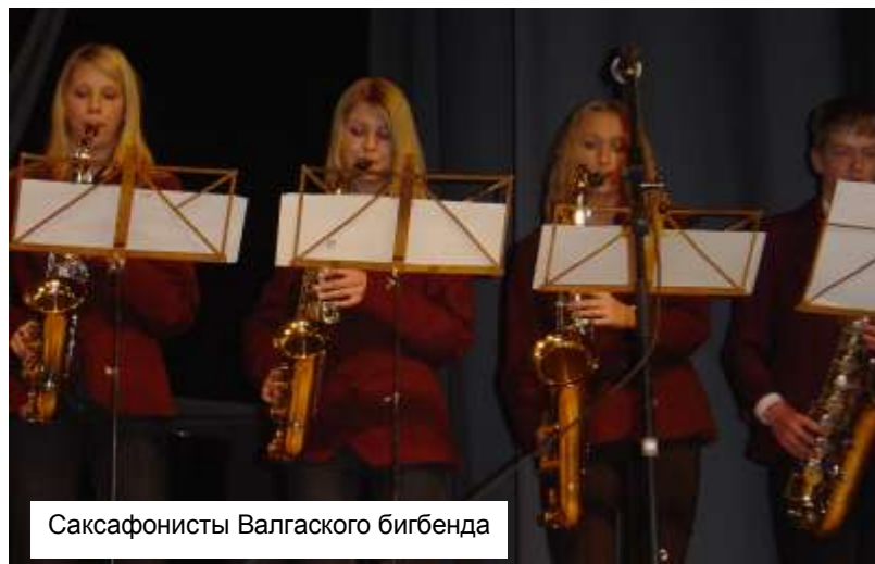
Саксафонисты Валгаского бигбенда