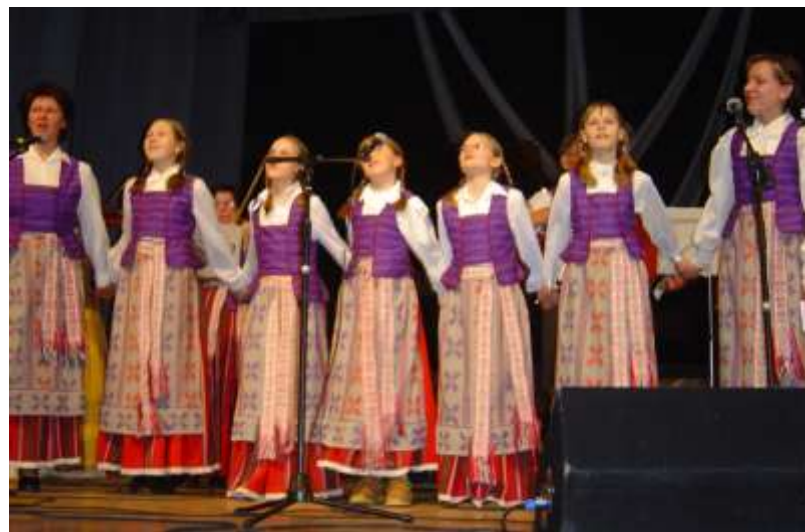
Звучит литовская народная песня - поет ансамбль из города Радилишкис