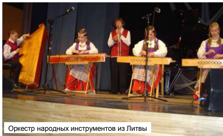
Оркестр народных инструментов из Литвы