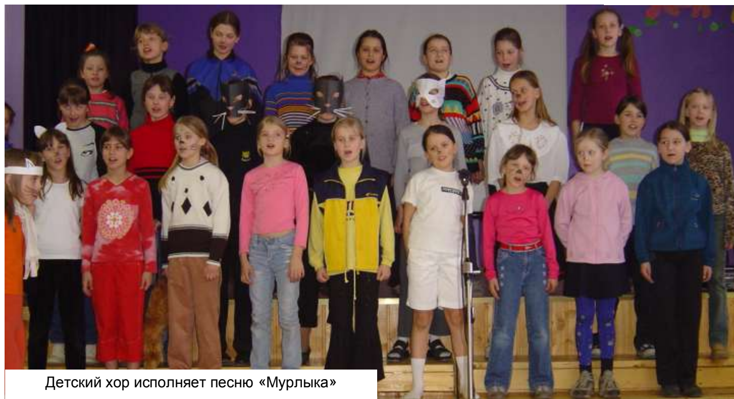
Детский хор исполняет песню «Мурлыка»

11 мая. Максимов день. Теплый ветер приносит здоровье. На Максима больных начинают отпаивать березовым соком.