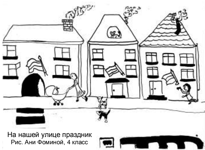
На нашей улице праздник Рис. Ани Фоминой, 4 класс