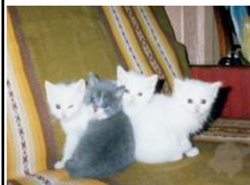
Близнецы Наилучшая фотография (Юганзон, 5кл.)