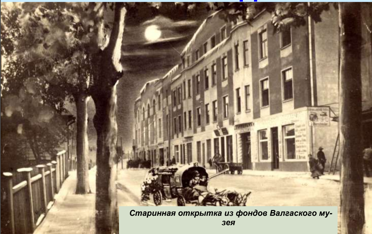
Старинная открытка из фондов Валгаского му- зея