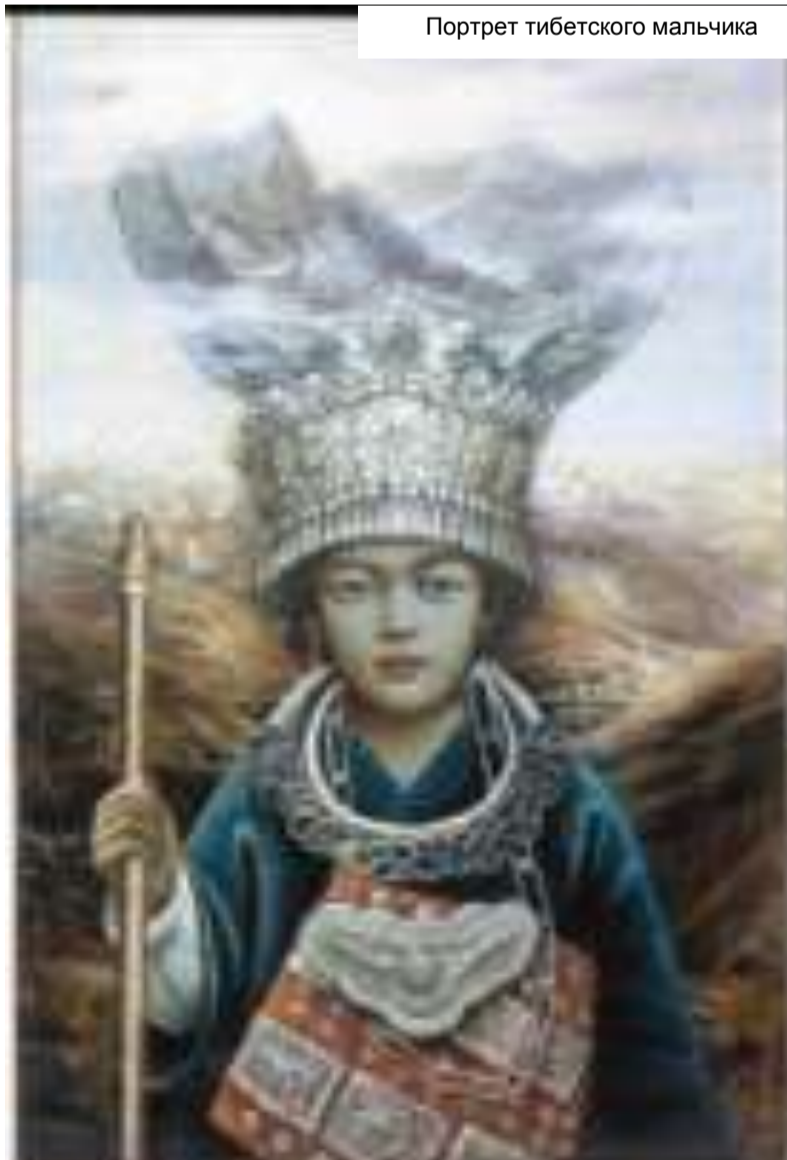
Портрет тибетского мальчика