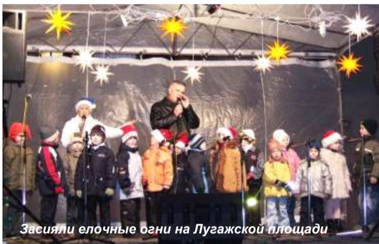
Засияли елочные огни на Лугажской площади

Валкская городская дума приобрела для города специальный трактор для чистки тротуаров, очень современный, многофункциональный. На покупку затрачено 10 000 латов.